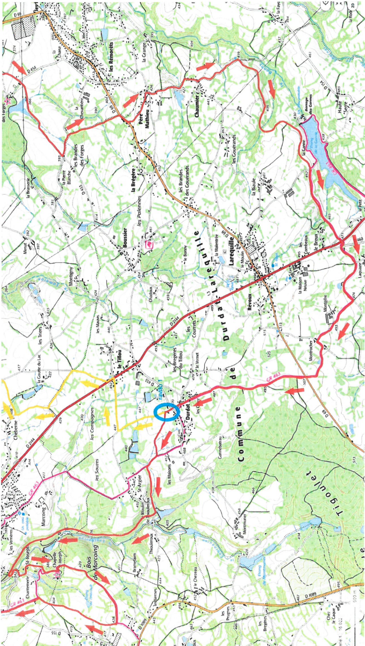
500 m Chez le Couque le Couque 16 022 feuille 1